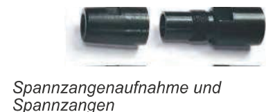
Spannzangenaufnahme und Spannzangen